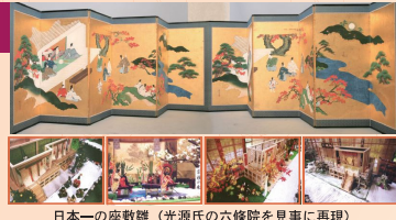
日本一の座敷雛 (光源氏の六條院を見事に再現)

飯塚市幸袋 300 TEL 0948-22-9700 入館料 300 円 2月10日(木)～4月4日(月) 9:30～17:00 (入場 16:30 まで)