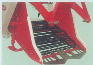
FDG,SFDG用 鉄先金、デバイダー