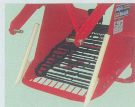
BL55D,65D用 鉄先金、デバイダー